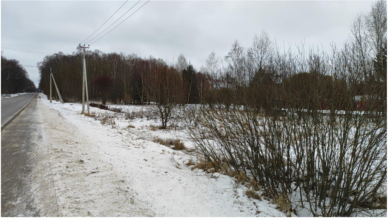
Фото 5 (доступ к земельному участку)